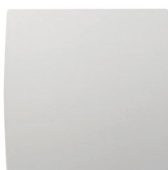
GRAPHIC vue de face