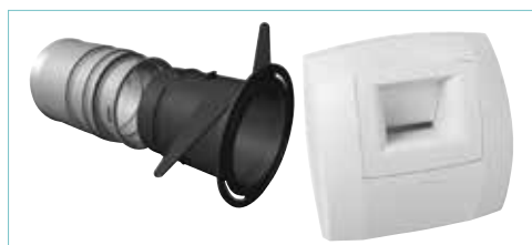
Recht koppelstuk Ø90 + klauwenmof Ø80 + Bahia-ventiel Ø80