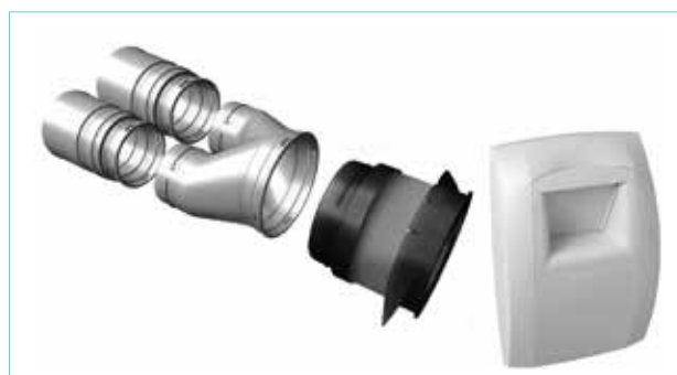
2 rechte koppelstukken Ø90 + broekstuk Ø125 + soepel koppelstuk Ø125 + Bahia-ventiel Ø125