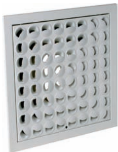
Plafondrooster SC 984