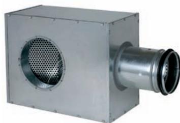
Plenum LREI 984