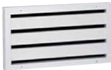
Rooster AG 183