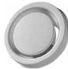
Rooster SR 148D