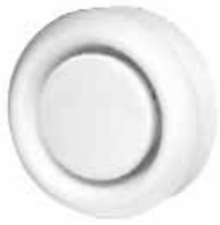
Rooster SR 147D