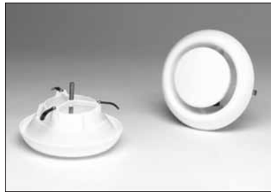
Rooster SR 147DK